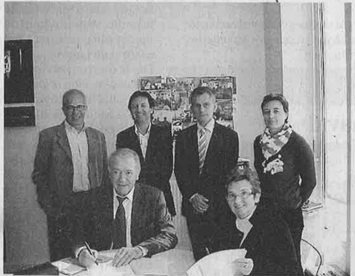
Signature régionale entre le Cidff et les 17 Missions locales.

Les missions locales en France sont devenues pour les jeunes entre 16 et 26 ans en recherche d'emploi ou en difficulté d'insertion, l'interlocuteur privilégié. En Languedoc-Roussillon, ce sont pas moins de 76 811 jeunes dont 37 812 femmes qui sont suivis par cette institution dans les dix-sept centres. Il était donc parfaitement utile d'associer les compétences du Centre d'information sur les droits des femmes et des familles (Cidff) et ceux des Missions locales pour une aide spécifique amenée aux jeunes femmes et aux familles. La coopération ira principalement vers la formation des 500 agents que comptent dans la région les MLI et vers un renforcement des liens dans le but d'aider un public de femmes, de mères et de pères à accéder, par le biais d'un intervenant justice, aux premières notions d'aides juridiques, et de les faire valoir, à aborder également la violence conjugale, les violences faites aux femmes et